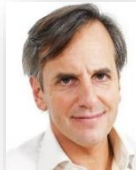
Bernard de La Villardière